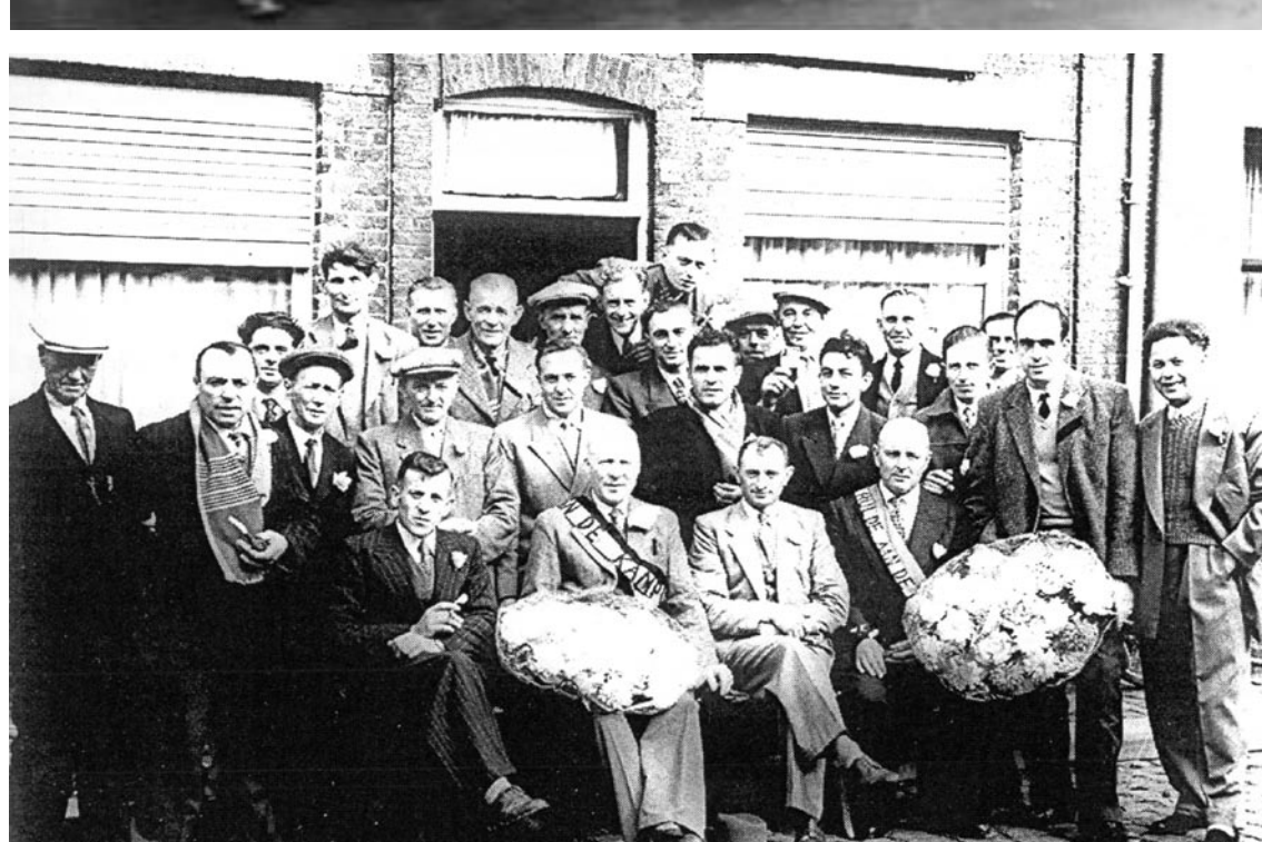
Twee kampioenvieringen in De Barze. De Barze is enkele jaren het lokaal geweest van de vinkeniërs Vreugde in de Zang en had ook een bloeiende kaartclub. Deze laatste werd er jaarlijks met Barzekermis getraakteerd op het typisch Vlaams gerecht: gestoofd konijn met appelmoes en aardappelen.