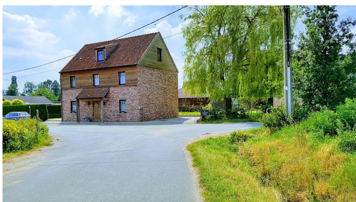
Café De Barze anno 2019